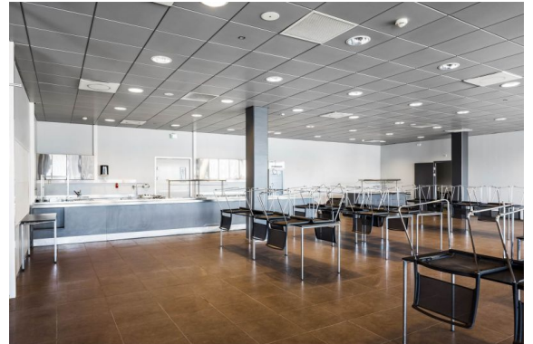
Helsinki Vuosaari - Satamakaari - Helsinki Helsinki Vuosaari Harbour - Service Center Warehouse Space: 1,233 m 2 Office Space: 2,499 m 2