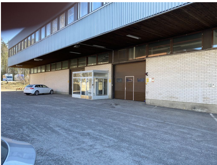
HANKASUONTIE 3, HELSINKI