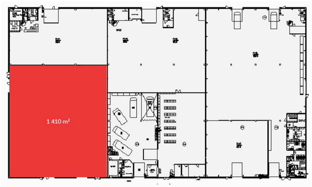
Koskelontie 21-25 – A-talo 1 kerros