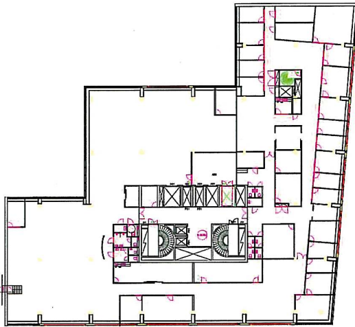
Esimerkkipohja, 5. kerros