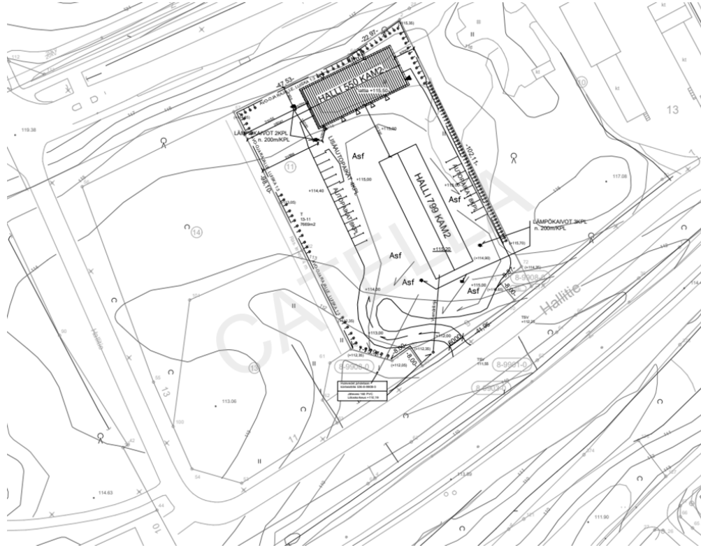
Asemapiirustus, ei mittakaavassa.