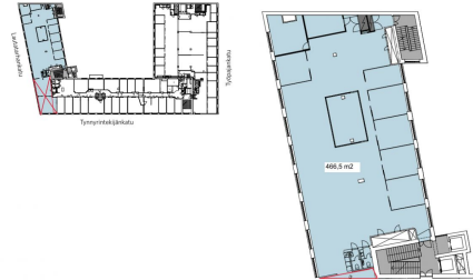
LINDSTRÖM TALO 00580 HELSINKI 4 KRS TILA 4.1 466,5 m 2 SISÄTILAPALVELU 10/2016