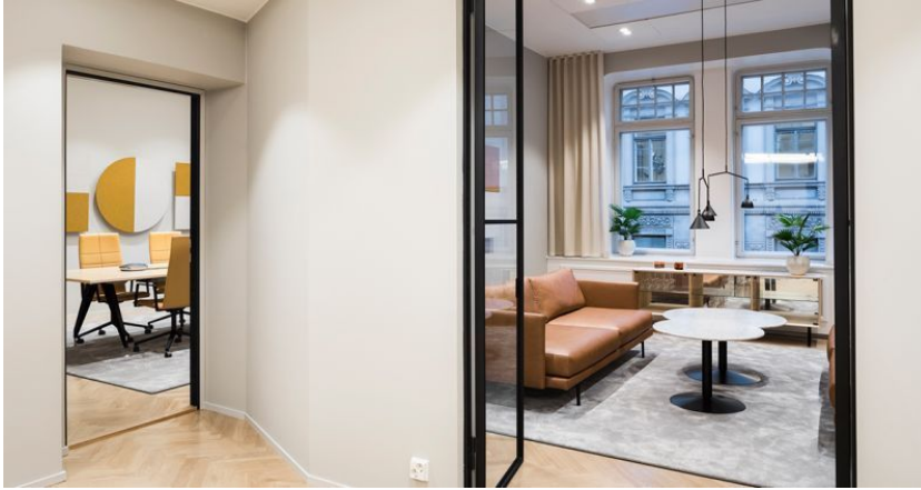
Aleksanterinkatu 44, 3. krs