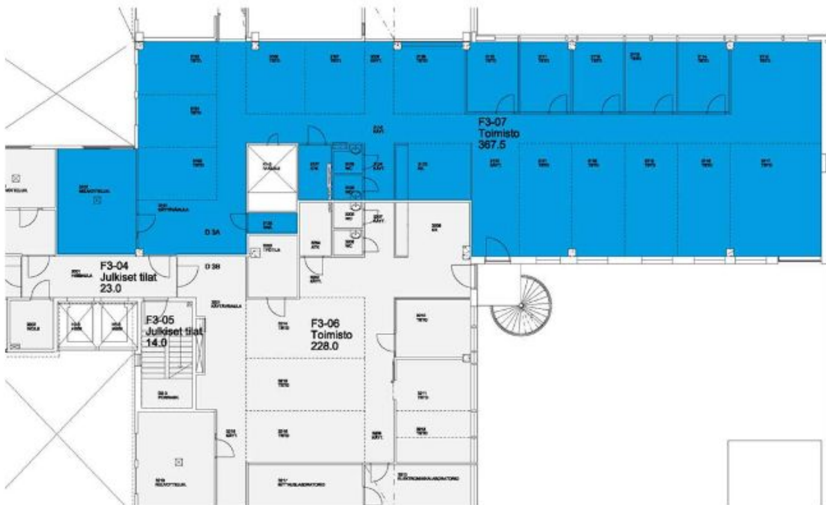
Bertel Jungin aukio 3 D-Talo -

Tilanne 19.01.2022 Huoneistot D-TALO (3.KERROS) F3-07 (367.50 m 2 )