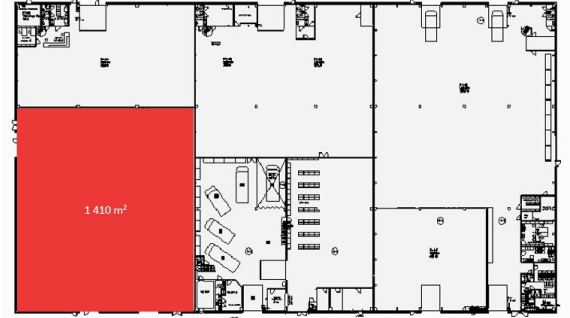
Koskelontie 21-25 – A-talo 1 kerros