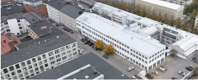
VALLILAN Akseli • Elina LEMUNTIE 7 ALAKELLARI K2