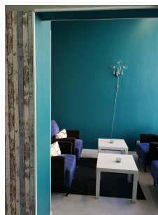
HÄMEENTIE 7 B, kokous tilalle 83 m 2 , korkeus 4 m