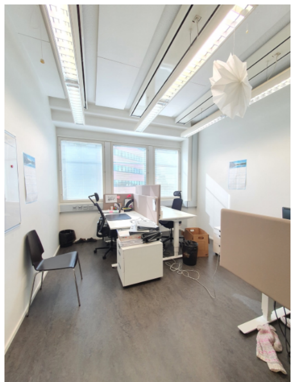
Esimerkkikuvia saman kiinteistön muista tiloista.